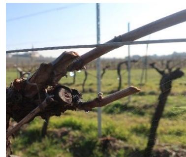
Riesling, Hochheim, 28.03.2022

Gestern Morgen konnten wir im Rheingau die ersten stark blutenden Riesling-Reben finden. Die warmen Tages-Temperaturen in den vergangenen Tagen haben die Vegetation vorangetrieben. In der kommenden Woche wird es kühler, weshalb die Entwicklung der Knospen noch etwas dauern wird.